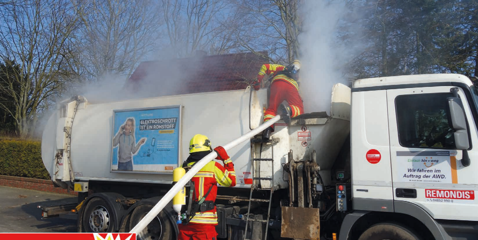
Nur dem umsichtigen Handeln des Fahrers und der Freiwilligen Feuerwehr in Marne ist es zu verdanken, dass das brennende Müllfahrzeug rechtzeitig gelöscht werden konnte.